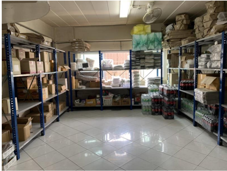
รูปคลังสินค้า