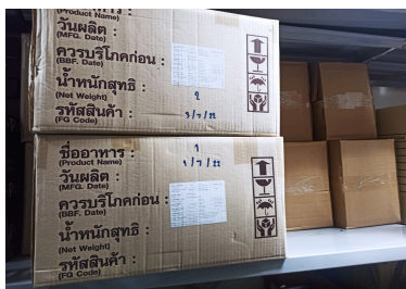
ภาพคลังสินค้าหลังจากการจัดแบบFEFO