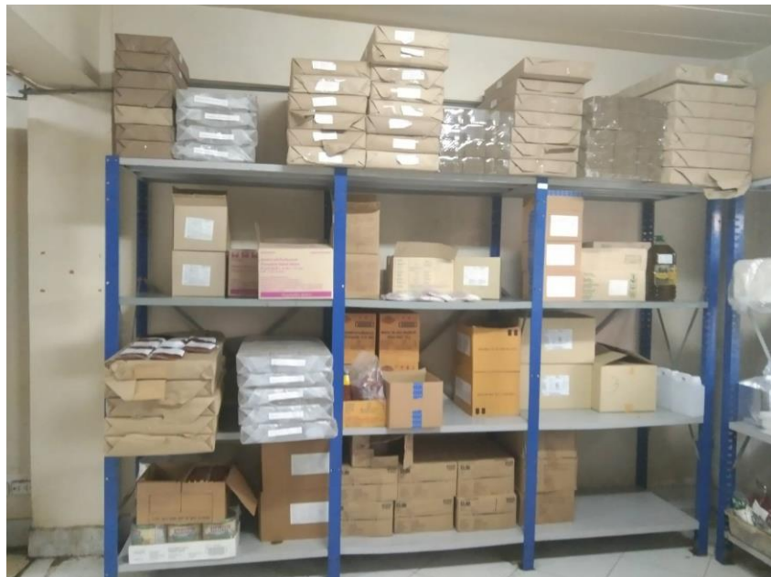
รูปคลังสินค้า