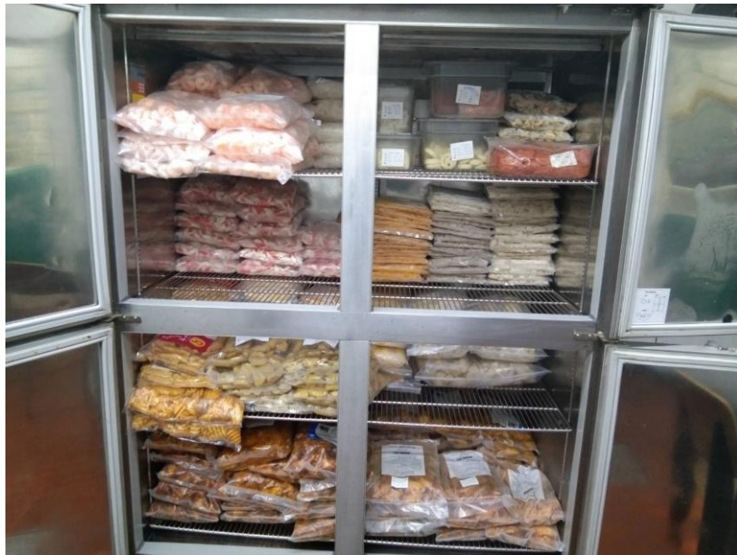
รูปคลังสินค้า(ของเย็น)