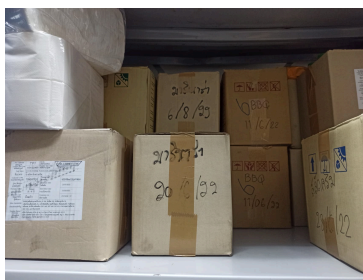
ภาพคลังสินค้าหลังจากการจัดแบบFEFO