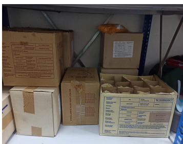
ภาพคลังสินค้าแบบเก่า