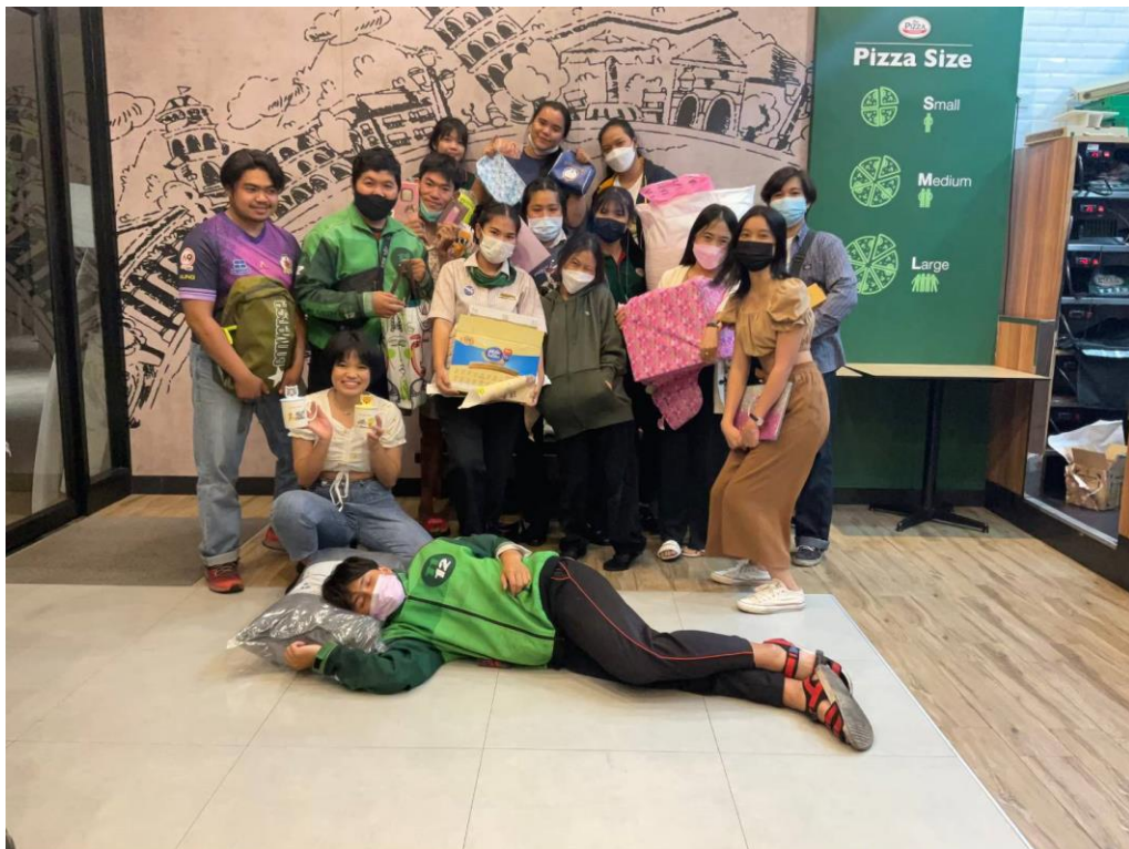
รูปความประทับใจกับพนักงานในร้าน