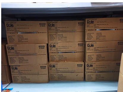
ภาพคลังสินค้าแบบเก่า