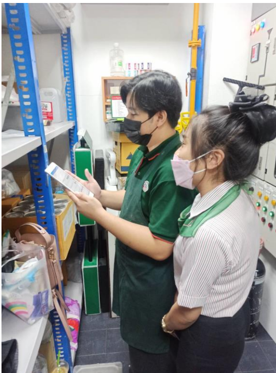
รูปภาพขณะนับสินค้า