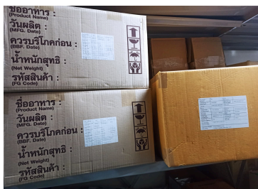
ภาพคลังสินค้าแบบเก่า