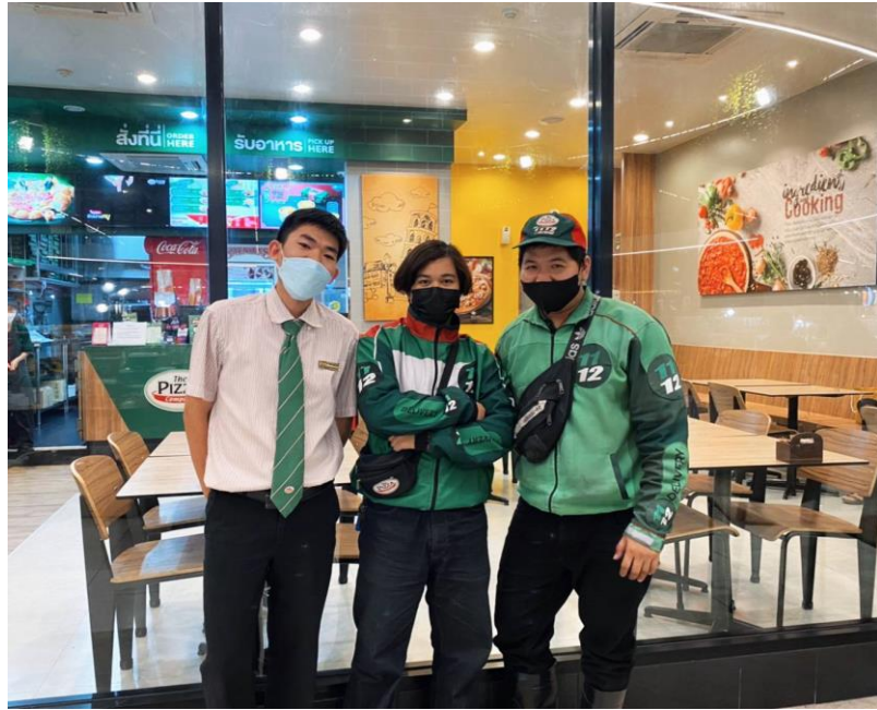
รูปความประทับใจกับพนักงานในร้าน