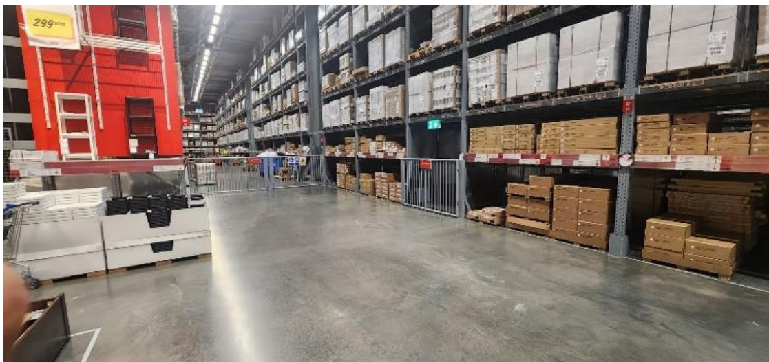
รูปที่ 1 บรรณาคคลังสินค้า