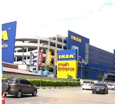
รูปที่ 1.1 บริษัท อีคาโน้ (ประเทศไทย) จำกัด

สถานประกอบการชื่อ บริษัท อีคาโน้ (ประเทศไทย) จำกัด ที่ตั้งเลขที่ 109,199,199/1-2 หมู่ที่ 6 ถนนรัตนวิบูลย์ ตำบลเสาธงหิน อำเภอบางใหญ่ จังหวัดนนทบุรี 11140