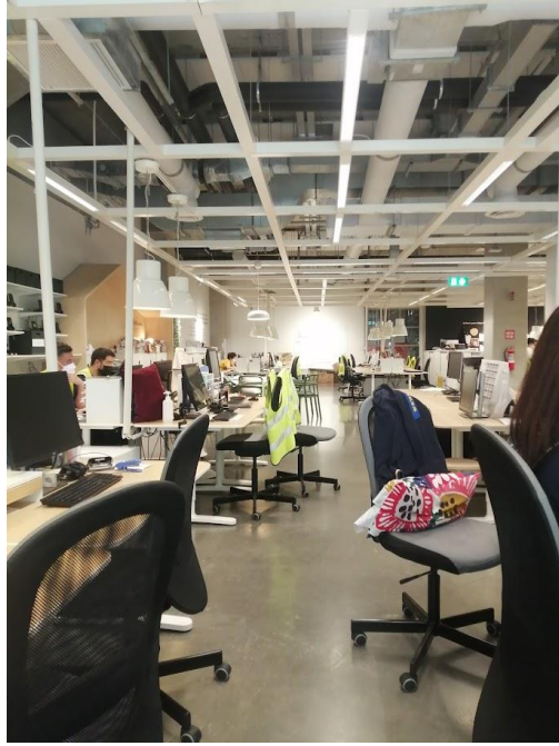
รูปที่ 3 บรรยากาศบริเวณโต๊ะทำงาน