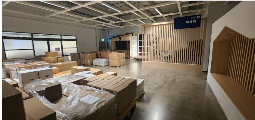
รูปที่ 4.3 พื้นที่การพักสินค้าและการกระจายสินค้าชั่วคราว

สรุปได้ว่านำเสนอการเพิ่มจุดพักสินค้าและการกระจายสินค้าเข้ามา ร่วมถึงการลดการคาดการณ์สินค้าลงมาใช้ในบริษัท อีคาโน่ (ประเทศไทย) จำกัด พบว่าช่วยให้บริษัทได้รับลดภาระทางด้านที่พื้นที่จัดเก็บไปเป็นอย่างมาก รวมถึงจำนวนสินค้าที่เข้ามาเก็บใน store ตรงกับยอดขายจริง และไปในทางที่ดีขึ้น และรวมถึงยังช่วยลดระยะเวลาในการเติมสินค้าระหว่างวันได้เป็นอย่างดี