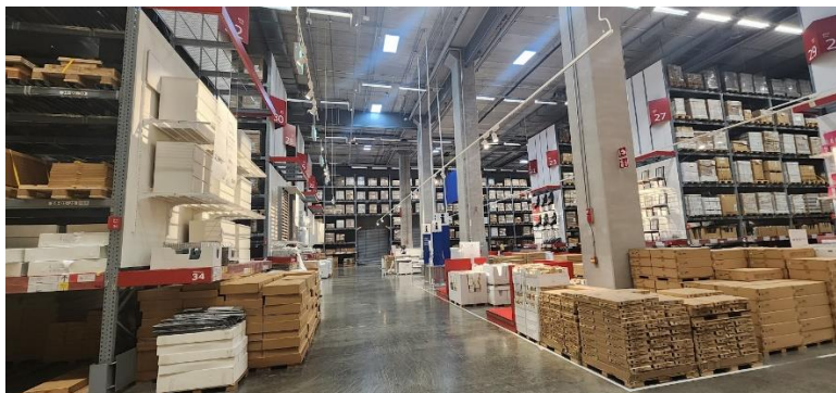
รูปที่ 3.4 คลังสินค้าที่ของบน Buffer ดูเหมือนจะไม่มีพื้นที่เหลือแล้ว