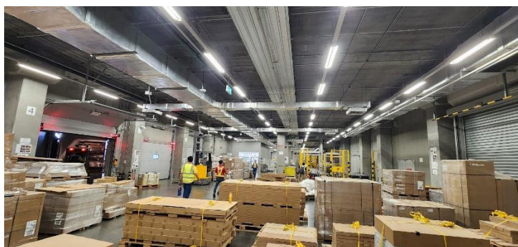
รูปที่ 3.3 Receive area