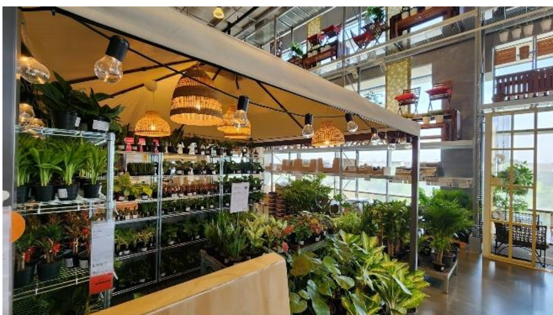
รูปที่ 2 โซนจัดแสดงสินค้า