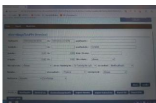
ตัวอย่างหน้าปรี้นใบเสร็จ