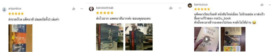
ตัวอย่างการรีวิวของลูกค้า

สรุปได้ว่าการนำทฤษฎี Lean Startup มาใช้ในบริษัท อมรินทร์บุ๊ค เซ็นเตอร์ จำกัด มาปรับเปลี่ยนจากวิธีเดิมทำให้การชำรุดของหนังสือลดน้อยลงหรือไม่มีการชำรุดของการแพ็คหนังสือเลย ทำให้ลดการเสียค่าใช้จ่ายสิ้นเปลืองอีกด้วย มีลูกค้าขอรับการแพ็คของทางบริษัทเพิ่มขึ้น