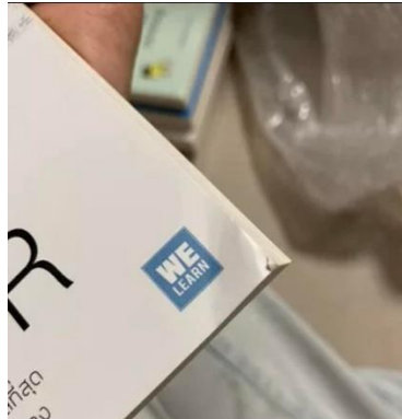
ตัวอย่างการ ชำรุดของหนังสือ

บริษัท อมรินทร์บุ๊ค เซ็นเตอร์ จำกัด มีปัญหาโดยหนังสือเกิดการชำรุด คือ มุมหนังสือเกิดการชำรุดจากการแพ็คสินค้าไม่ดี ทำให้มุมหักงอ หนังสือเปลี่ยนสภาพ