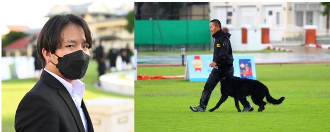
3.1.3 ตัวอย่างการถ่ายภาพเพื่อการประชาสัมพันธ์ในงานแข่งขัน