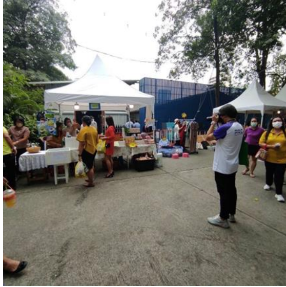
3.1.7 ถ่ายงาน วันลอยกระทง ณ กรมประชาสัมพันธ์