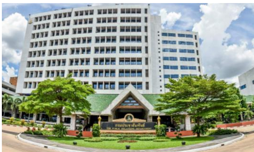
ภาพที่ 1.3 ภาพกรมประชาสัมพันธ์

สำนักงานกรมประชาสัมพันธ์ เดิมตั้งอยู่ที่ อาคารห้วมุมถนนราชดำเนิน ติดกับกรมสรรพากร และสำนักงานสลากกินแบ่งรัฐบาล เป็นสถานที่เกี่ยวข้องกับประวัติศาสตร์ทางการเมืองหลายครั้ง ในการรัฐประหารทุกครั้ง จะเป็นสถานที่แรก ๆ ที่ถูกกำลังทหารเข้ายึด รวมทั้งใน เหตุการณ์ 14 ตุลา และเหตุการณ์พฤษภาทมิฬ ก็ถูกประชาชนเข้ายึด [4] หลังเหตุการณ์พฤษภาทมิฬ อาคาร กรมประชาสัมพันธ์ถูกเพลิงไหม้เสียหายอย่างหนัก จึงย้ายไปตั้ง ณ อาคารเลขที่ 9 ซอยพระรามที่ 6 ซอย 30 (อารีย์สัมพันธ์) ถนนพระรามที่ 6 แขวงพญาไท เขตพญาไท กรุงเทพมหานคร จนถึงปัจจุบัน