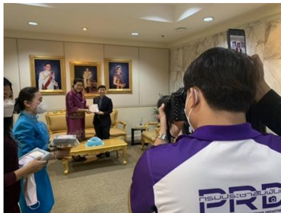
3.1.6 ตัวอย่างการถ่ายภาพเพื่อการประชาสัมพันธ์ในการสัมมนา ณ ห้อง อธิปติกรรมประชาสัมพันธ์