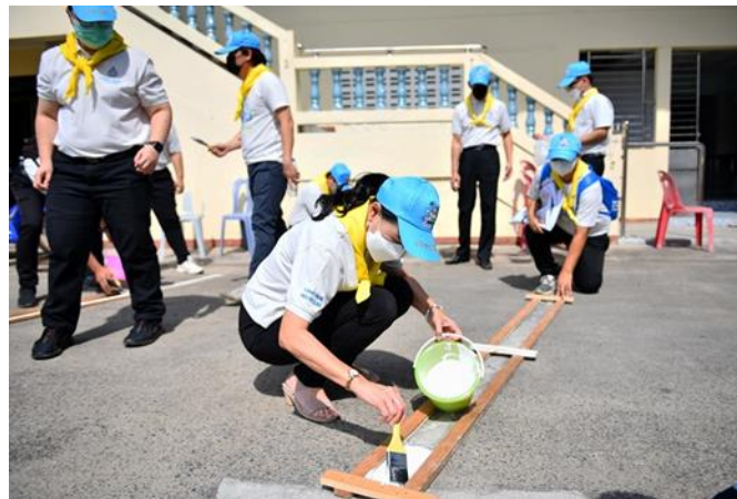
3.1.8 ถ่ายงานจิตอาสา คณะกรมประชาสัมพันธ์ และ สภากาชาดไทย ณ วัดแก้วฟ้าจุฬามณี