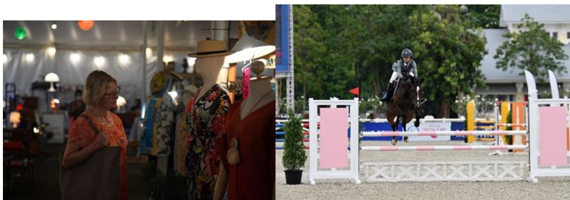
3.1.4 ตัวอย่างการถ่ายภาพเพื่อการประชาสัมพันธ์ในงานPrincess's Cup Thailand