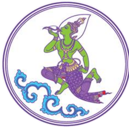
ภาพที่ 1.1 ตราสัญลักษณ์ กรมประชาสัมพันธ์

ในการฝึกปฏิบัติงานในครั้งนี้ นิสิตสาขาการโฆษณาและการประชาสัมพันธ์ คณะนิเทศศาสตร์ มหาวิทยาลัยราชพฤกษ์ ได้รับความอนุเคราะห์จาก กรมประชาสัมพันธ์ ให้นิสิตได้มาปฏิบัติงานในสถานประกอบการจริงเพื่อประกอบการศึกษา และพัฒนาทักษะการเรียนรู้และประสบการณ์ การทำงานจริง ซึ่งนิสิตได้เข้าร่วมฝึกปฏิบัติงานเกี่ยวกับงานด้านการบันทึกภาพและผลิตสื่อประชาสัมพันธ์ เพื่อช่วยในการจัดทำสื่อประชาสัมพันธ์ ภายใต้ภารกิจประชาสัมพันธ์ต่าง ๆ ของกรมประชาสัมพันธ์ รวมทั้ง การนำเสนอข้อมูลข่าวสารผ่านช่องทางอื่น ๆ เช่น เฟซบุ๊ก ไลน์ วิกิพีเดีย/โครงการ/กิจกรรม TikTok โครงการ/กิจกรรม เพื่อเป็นการประชาสัมพันธ์โครงการ/กิจกรรมนั้น ๆ เสริมสร้างภาพลักษณ์ที่ดี จึงขอนำเสนอประวัติความเป็นมาของกรมประชาสัมพันธ์ ดังนี้