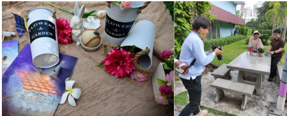
3.1.2 ตัวอย่างการถ่ายภาพเพื่อการประชาสัมพันธ์ของแกลกของกรมประชาสัมพันธ์