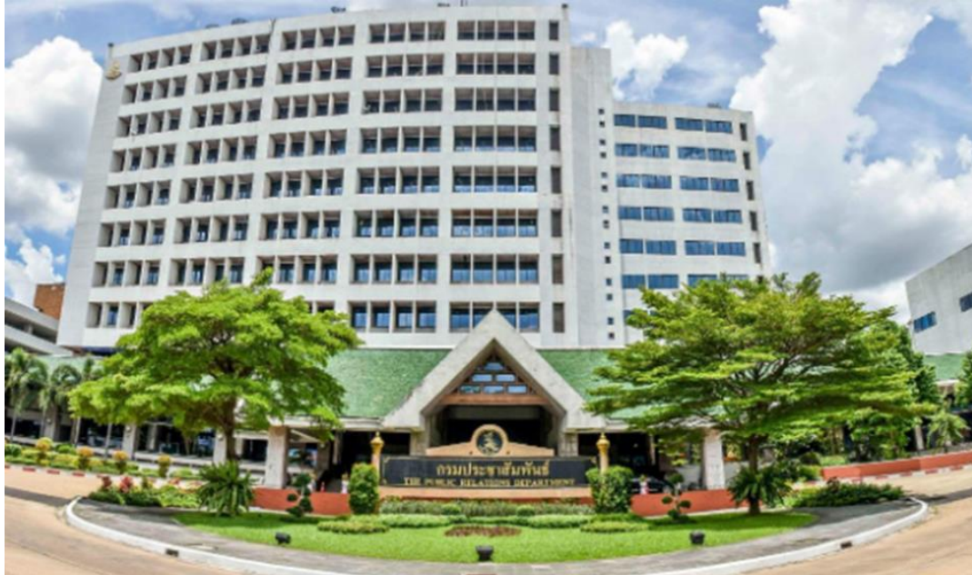
ภาพที่ 1.2 ภาพสถานที่ตั้งกรมประชาสัมพันธ์

อธิบายชี้แจงให้ประชาชนเข้าใจอย่างกว้างขวางเป็นการสร้างความเข้าใจ อันดี โดยมีวิทยุ โทรทัศน์ หนังสือพิมพ์ และภาพยนตร์เป็นเครื่องช่วย จึงเปรียบได้กับการเป่าสังข์ของท้าวดาในสมัยโบราณเพื่อบอก สัญญาณ และเรียกประชุม