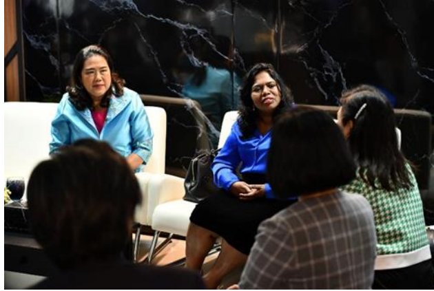
3.1.9 ถ่ายงานประชาสัมพันธ์ ผู้อำนวยการสถาบันพัฒนาจัดการวิทยุ-โทรทัศน์แห่งเอเชีย-แปซิฟิก