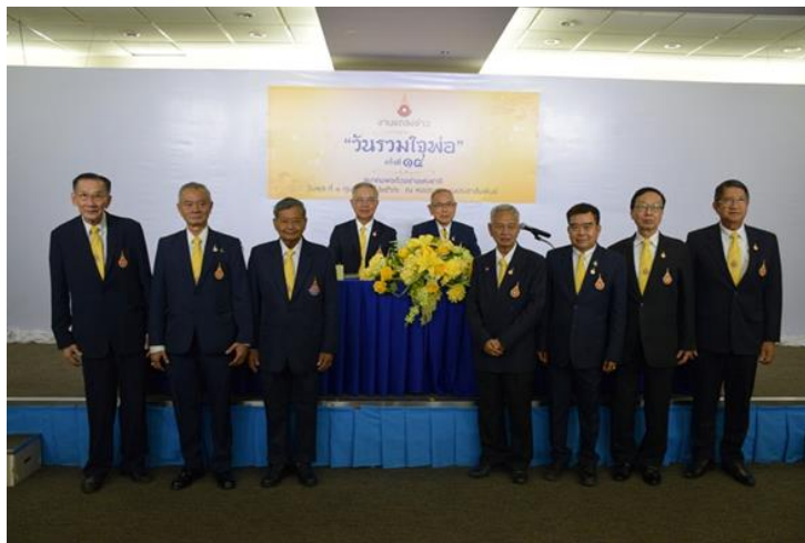
3.1.10 ถ่ายงานประชาสัมพันธ์ สมาคมพ่อตัวอย่าง แดลงข่าวการจัดงาน"วันรวมใจพ่อ ครั้งที่ 14