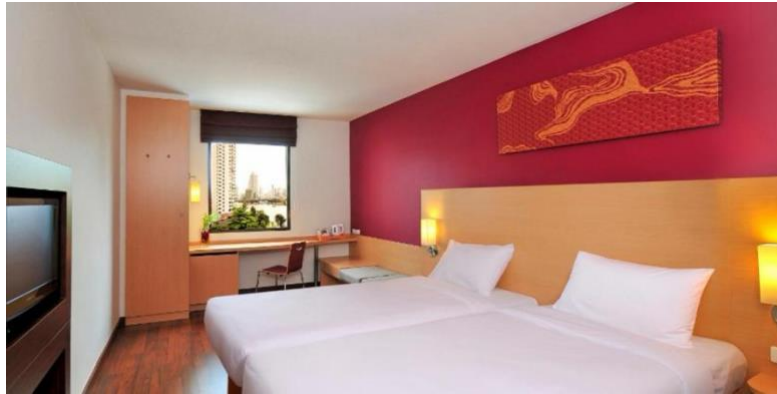
ภาพที่ 1.3 ห้องพักรีสแตนดาร์ด ทวิน รูม ริเวอร์ วิว (Standard Twin Room River view)

ห้องพัก ห้องพักรีสแตนดาร์ด ทวิน รูม ริเวอร์ วิว (Standard Twin Room River view)