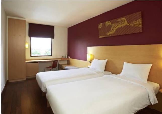
ภาพที่ 1.1 ห้องพักสแตนดาร์ด ทวิน (Standard Twin)

ห้องพักสแตนดาร์ด ทวิน (Standard twin bed) ขนาด 21 ตารางเมตร ห้องพักมองเห็นเมือง กรุงเทพมหานคร ที่จะได้มองเห็นวิวสวยๆ บรรยากาศดีๆในวันพักผ่อน และแสงไฟยามค่ำคืนของเมือง ทุกห้องของโรงแรมมีเครื่องปรับอากาศทำความเย็น และมองเห็นถึงแม่น้ำเจ้าพระยา ในห้องพักจะมีห้องน้ำที่ใช้เครื่องทำน้ำอุ่น ซึ่งเหมาะต่อการพักผ่อนหย่อนใจ จำนวนห้องพักของโรงแรมจะมีทั้งหมด 266 ห้อง และเป็นห้องพักที่ปลอดภัยควินบุหรี