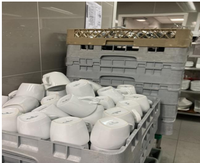
ภาพที่ 4.3 เช็ดแก้วน้ำและแก้วกาแฟ