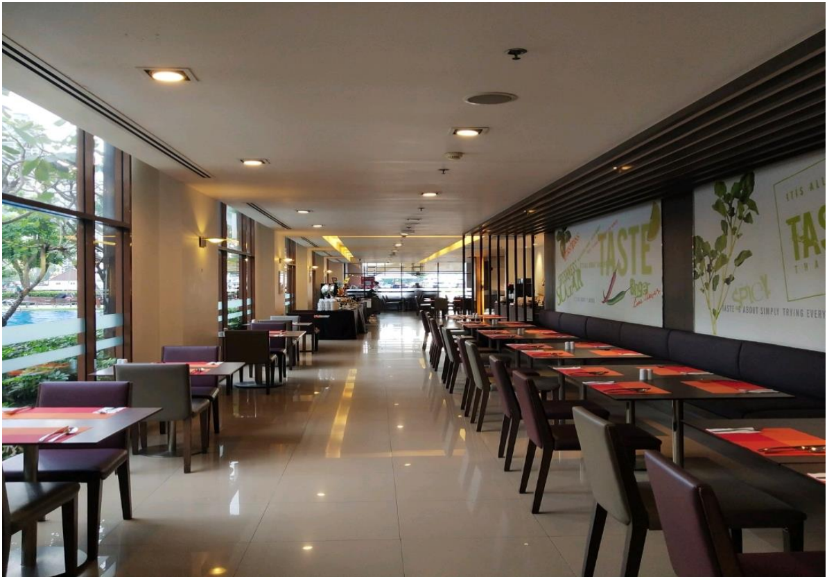
ภาพที่ 2.1 ห้องอาหาร เทสต์

ห้องอาหาร Taste เปิดบริการเวลา 06.00 น. ถึง 22.00 น.