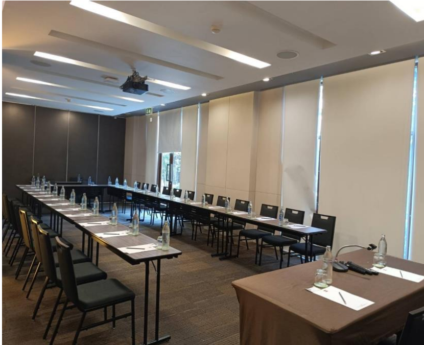
ภาพที่ 4.3 ห้องประชุมจตุจักร