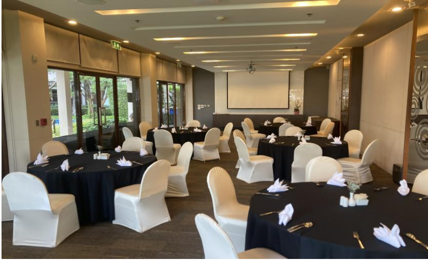
ภาพที่ 4.1 ห้องประชุมเบญจกิติ