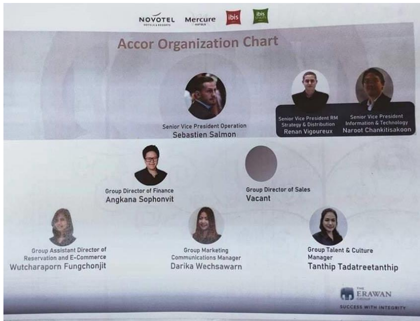
ภาพที่ 1.4 Accor Organization Chart