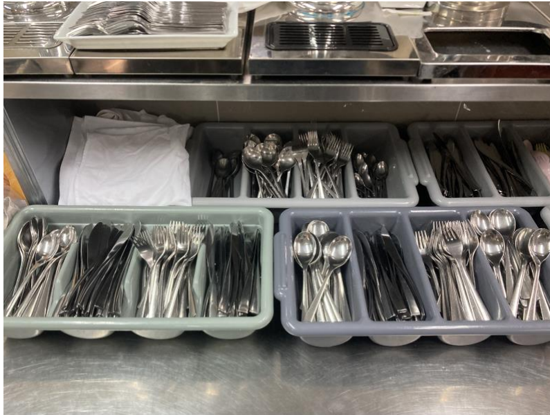
ภาพที่ 4.4 แยกประเภทอุปกรณ์

9.3 นำอุปกรณ์จัดไลน์บุฟเฟต์แยกไว้ต่างหาก