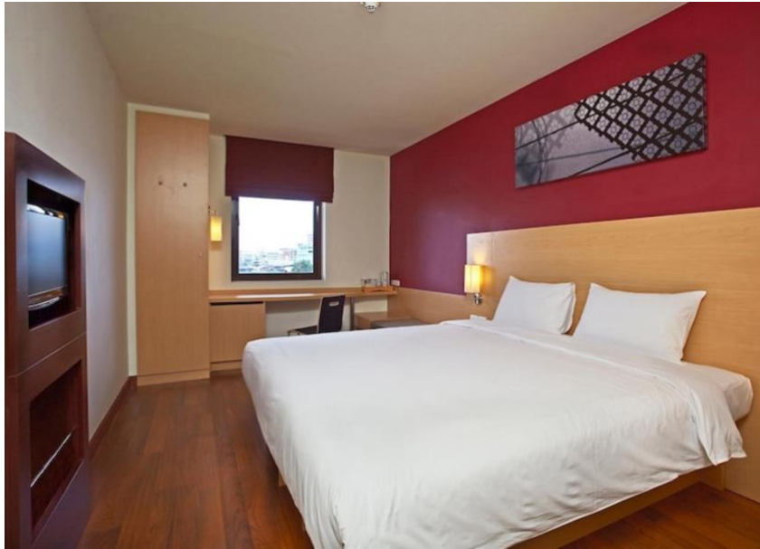
ภาพที่ 1.4 ห้องพักรีสแตนดาร์ด ดับเบิล รูม ริเวอร์ วิว (Standard Double Room River view)