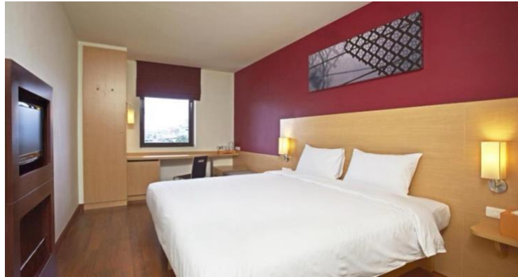
ภาพที่ 1.2 ห้องพักรีสแตนดาร์ด ดับเบิ้ล (Standard Double bed)

ห้องพักรีสแตนดาร์ด ดับเบิ้ล (Standard Double bed) ขนาด 21ตารางเมตร ห้องพักรที่มีเตียงนอนอัน แสนนุ่ม พร้อมกับเตียงดับเบิ้ล มองเห็นวิวสระว่ายน้ำ ต้นไม้รอบๆโรงแรมและดอกลีลาวดีอันแสนเป็น ธรรมชาติ ทุกห้องนอนมีเครื่องปรับอากาศทำความเย็น ห้องพักรนี้สามารถพักรได้ ผู้ใหญ่ 2 คน เด็ก 1 คน ห้องพักรได้มีการจัดวางตามความเหมาะสมของห้องนอน ราคา 2,174 บาท