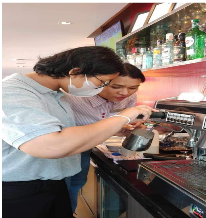
ภาพที่ 4.6 การทำเครื่องดื่ม