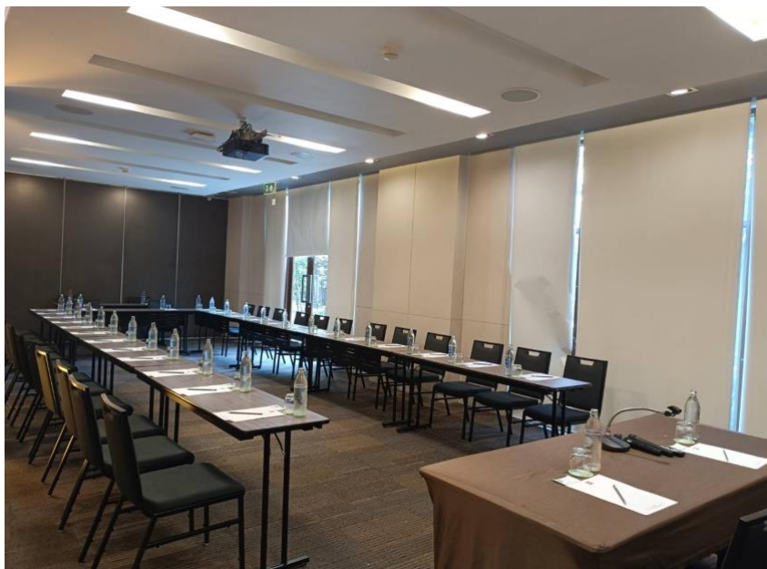
ภาพที่ 4.4 ห้องประชุม รมณีนาค