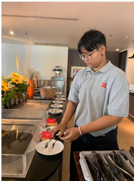
ภาพที่ 5.0 เตรียมอุปกรณ์จัดไลน์ตอนเย็น