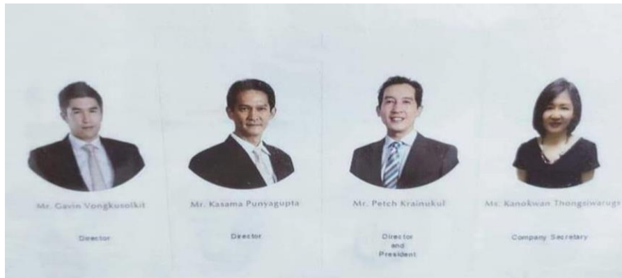
ภาพที่ 1.6 Board of Directors