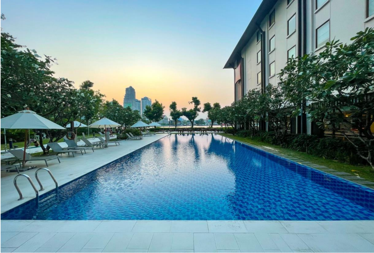
ภาพที่ 2.2 สระว่ายน้ำ

สระว่ายน้ำกลางแจ้ง เปิดให้บริการตั้งแต่ 07.00-19.00 น.ของทุกวัน มีบริการผ้าเช็ดตัว