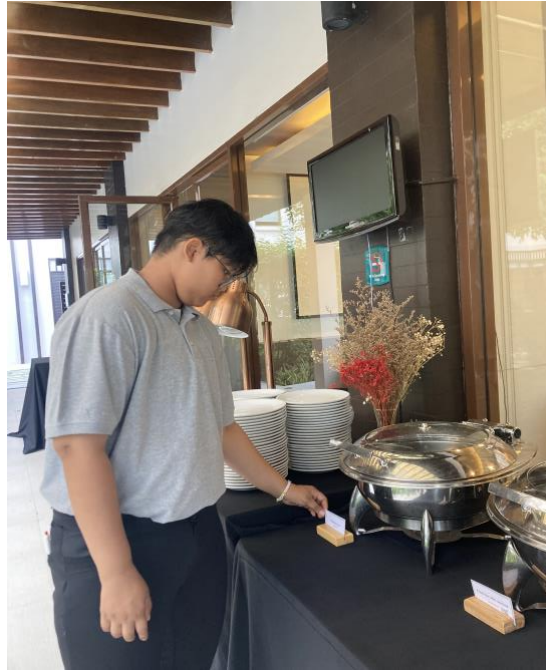
ภาพที่ 4.7 การจัดห้องประชุม