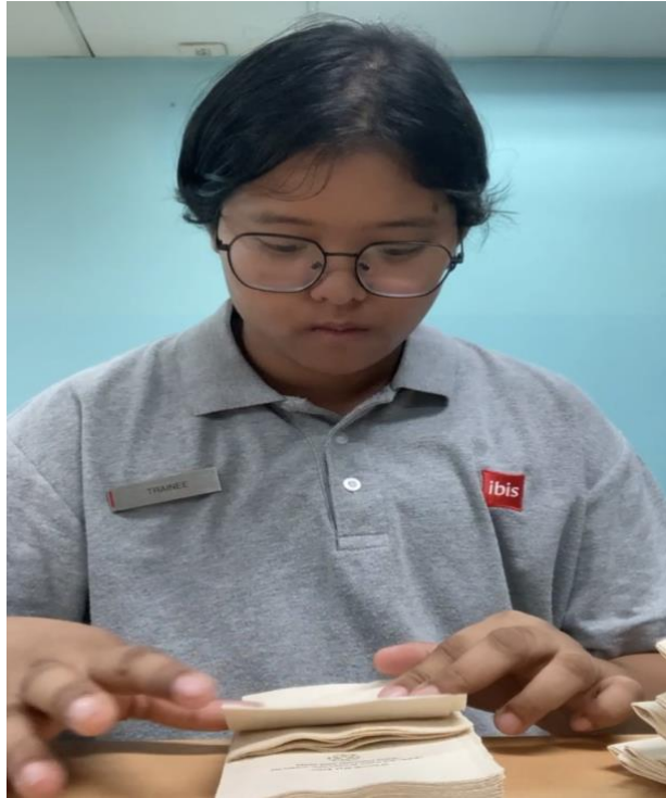
ภาพที่ 4.9 พับกระดาษทิชชู