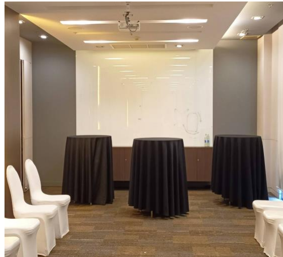
ภาพที่ 4.8 จัดห้องประชุม birthday party