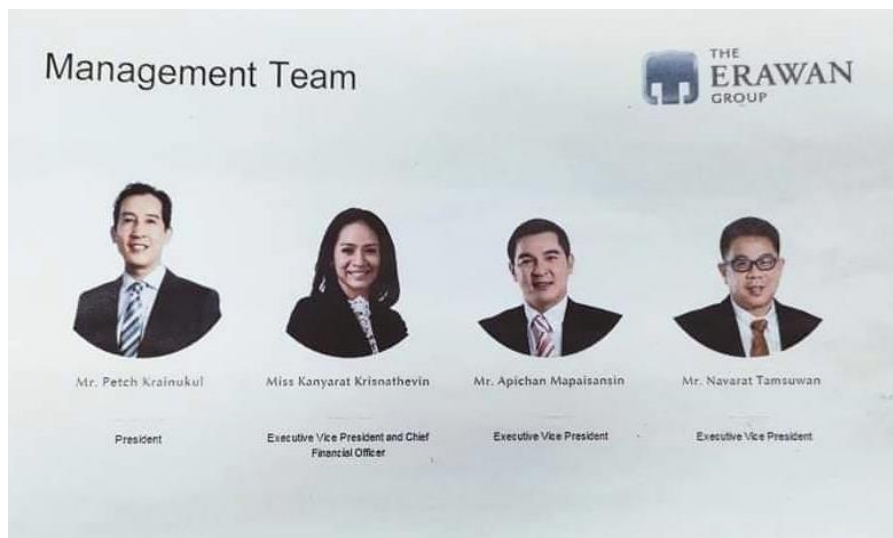
ภาพที่ 1.7 Management Team