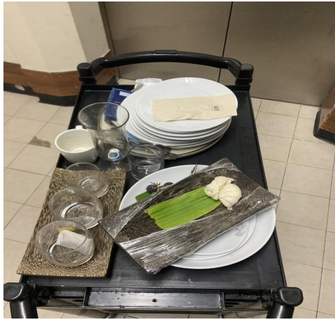
ภาพที่ 4.5 เคลียร์ฟลอร์แต่ละชั้น

10.5 เมื่อเก็บครบทั้ง 7 ชั้นแล้ว นำลงมาแยกขยะแยกภาชนะสำหรับล้างให้เรียบร้อย