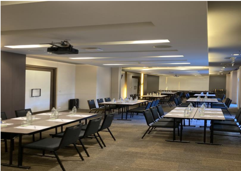
ภาพที่ 4.2 ห้องประชุม แกรนด์บอลรูม