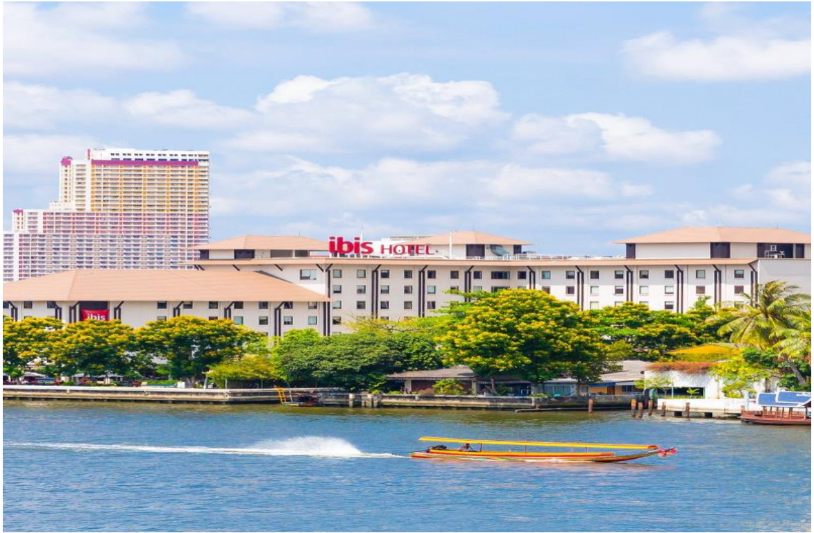
ภาพที่1.11 Ibis Bangkok Riverside

โรงแรม ไอบิส กรุงเทพ ริเวอร์ไซด์ โรงแรมระดับ 3 ดาว บริหารโดย เครือแอกคอร์ด