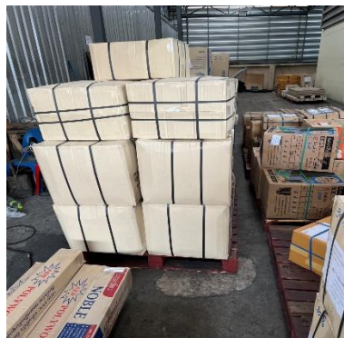
รูปที่ 3.3 จัดสินค้าให้คนรถส่งปลายทาง

จากการปฏิบัติงานที่ผ่านมาเราได้เห็นถึงปัญหาที่เกิดขึ้นในการดำเนินงานแบบเดิมโดยการลงสินค้า แบบเดิมทำให้เกิดความเสียหายของสินค้าทำให้สินค้าชำรุดเสียหาย มีการแตกหักจากการกระแทก เป็นต้น ทำให้มีการตีกลับสินค้าจากลูกค้าที่มาใช้บริการ เราจึงมีโอกาสนำความรู้ที่ได้ ศึกษา มาปรับใช้ในการแก้ไขปัญหา จึงได้นำความรู้จาก Lean : Startup