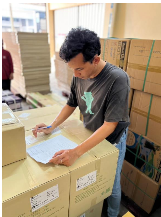
เช็คสินค้าในคลัง