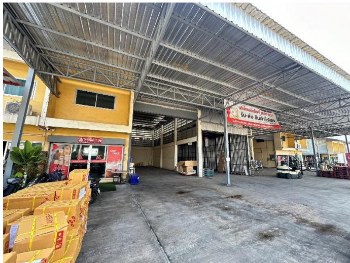
รูปที่ 1.1 บริษัท เอเอเอ็นที ทรัค จำกัด

สถานประกอบการชื่อ : บริษัท เอเอเอ็นที ทรัค จำกัด