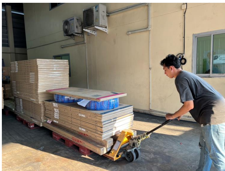
เก็บสินค้าเข้าคลัง