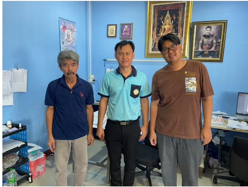
อาจารย์มานิเทศที่สถานประกอบการ