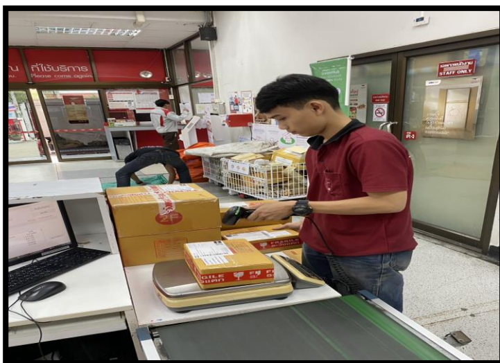
รูปที่ 3.3 การยิงสินค้าและพัสดุที่จุด Drop off