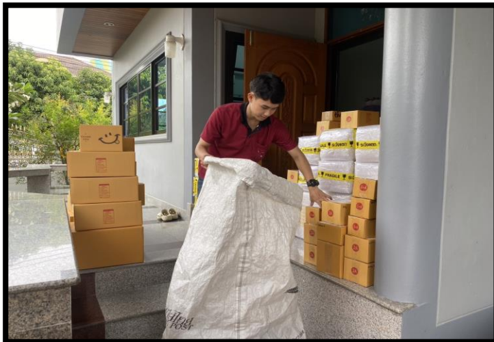
รูปที่ 3.2 การออกไปรับพัสดุและสินค้า