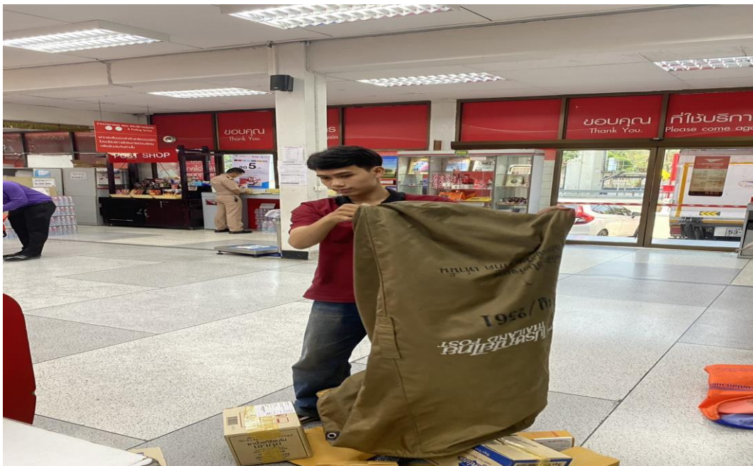
รูปภาพที่ 3.4 การเทพัสดุออกจากถุงโดยไม่มีการกลับด้านถุง

จากการปฏิบัติงานที่ผ่านมา รวมถึงการลงพื้นที่ไปศึกษาหน้าที่การทำงานด้วยจริง จึงสังเกตเห็นรวมถึงแนะนำให้ควรมีระบบการบันทึกและตรวจสอบจำนวนพัสดุและสินค้าก่อนและหลังการรับพัสดุทุกครั้ง เพื่อป้องกันความผิดพลาดที่อาจเกิดขึ้น เช่น การตรวจสอบจำนวนพัสดุที่ได้รับจากผู้ส่งและทบทวนข้อมูลที่ บันทึกไว้ โดยการใช้เอกสารหรือเทคโนโลยีเช่นแอปพลิเคชันหรือระบบฐานข้อมูลที่สามารถเก็บข้อมูลจำนวนพัสดุได้อย่างแม่นยำ