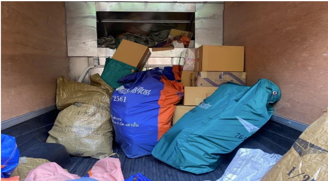
รูปภาพ พัสตุและสินค้าที่ออกไปรับขณะฝึกปฏิบัติงานสหกิจศึกษา