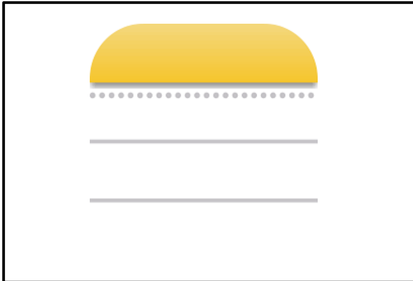
ภาพที่ 4.1 Application Note ที่ใช้ในการจัดบันทึกจำนวนพัสดุ