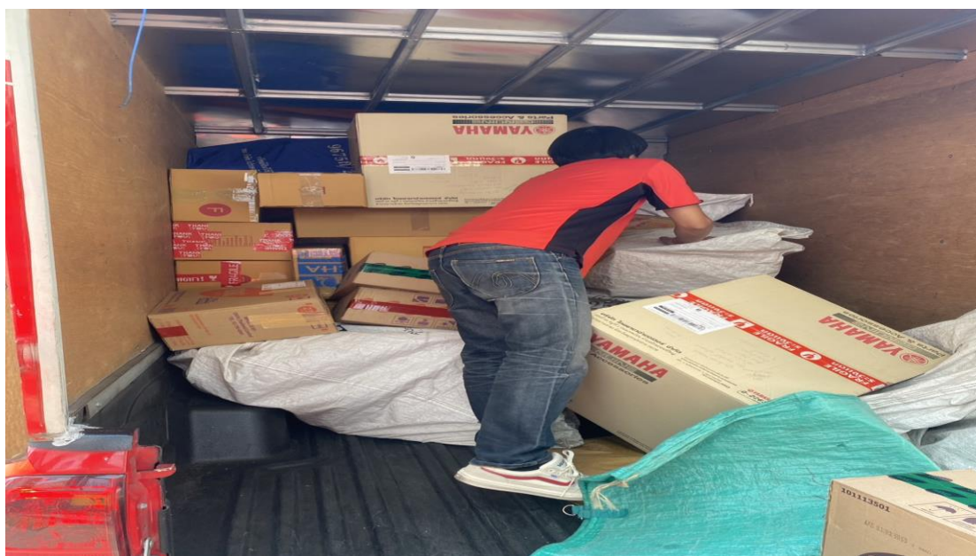
รูปภาพที่ 3.5 กระบวนการรับพัสดุโดยไม่มีการจดบันทึกจำนวน