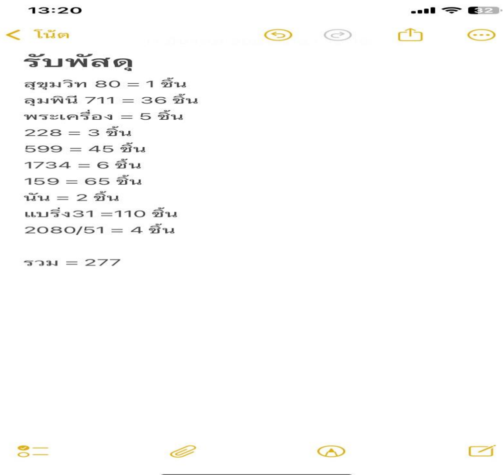
ภาพที่ 4.2 การจัดบันทึกจำนวนพัสดุและสินค้าผ่าน Application Note