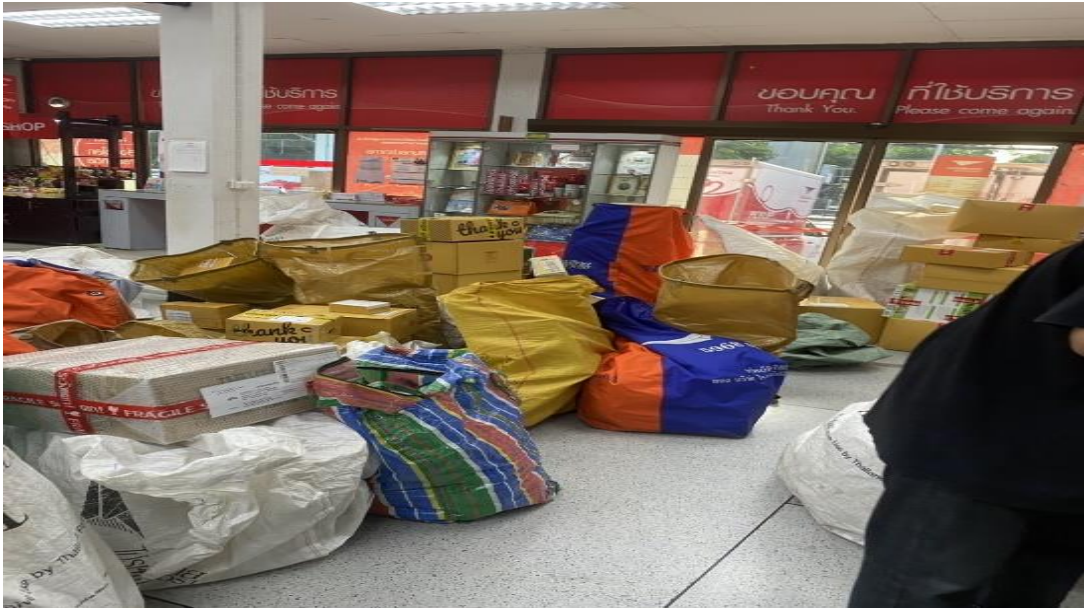
รูปภาพ พัสตุและสินค้าที่ออกไปรับขณะฝึกปฏิบัติงานสหกิจศึกษา