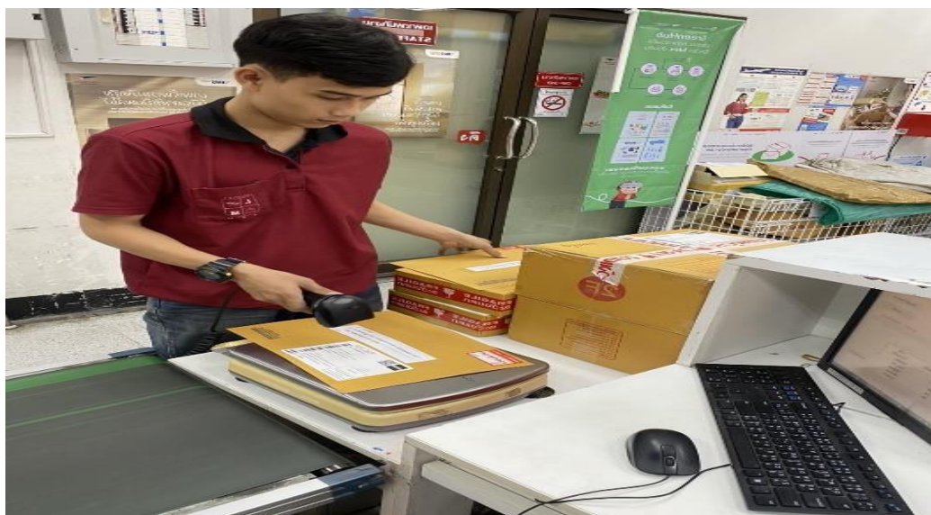
รูปภาพ การฝึกปฏิบัติงานสหกิจศึกษา ณ สถานประกอบการ