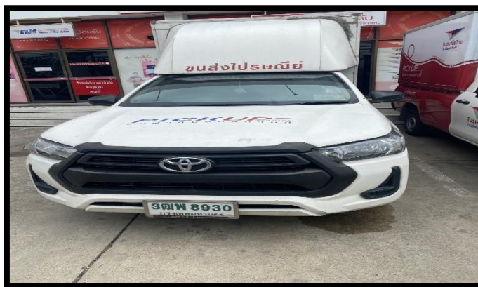
รูปที่ 3.1 รถที่ใช้ในการออกไปรับสินค้าและพัสดุตามจุดต่างๆ