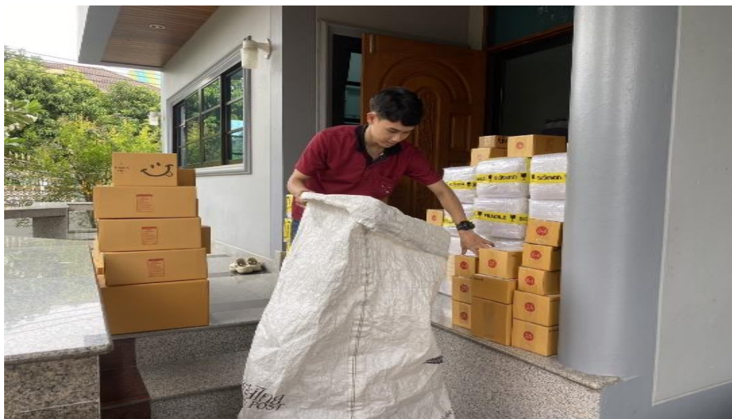
รูปภาพ การฝึกปฏิบัติงานสหกิจศึกษา ณ สถานประกอบการ