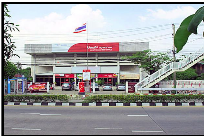
รูปที่ 1.1 ไปรษณีย์ไทย สมุทรปราการ