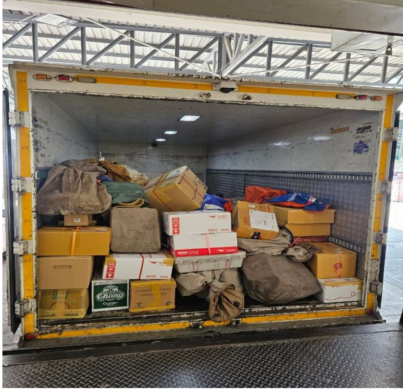
ภาพที่ 3.3 ตัดรอบและทำการจัดส่งพัสดุ