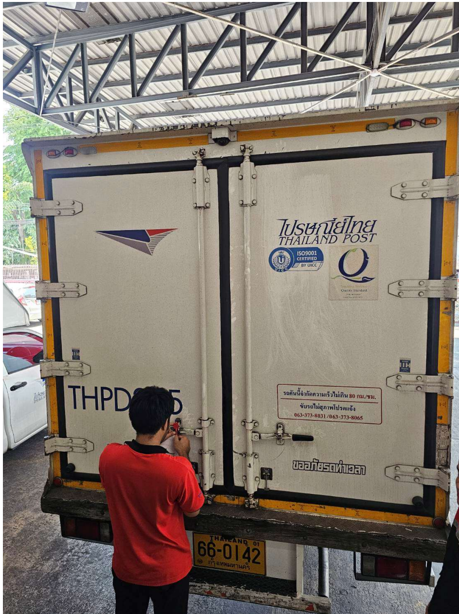
รูปภาพการฝึกปฏิบัติงานสหกิจศึกษา ณ สถาบันประกอบการ