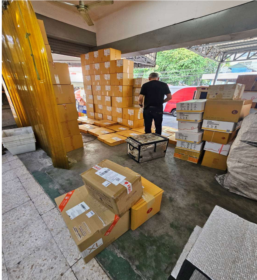
รูปภาพการฝึกปฏิบัติงานสหกิจศึกษา ณ สถาประกอบการ