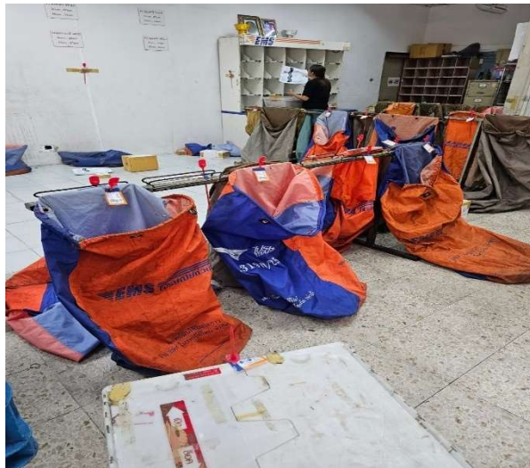
ภาพที่3.2 ยิงพัสดุลงถ่วงให้แต่ละสายขนส่ง