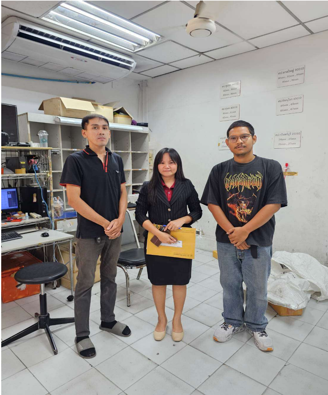
รูปภาพการฝึกปฏิบัติงานสหกิจศึกษา ณ สถาประกอบการ