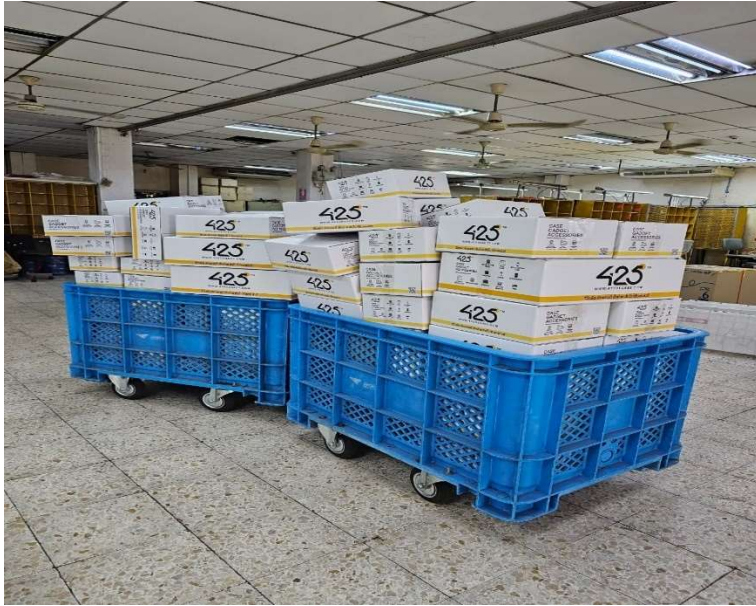
ภาพที่3. 1 ยิงขึ้นงานพัสดุให้แต่ละสายขนส่ง